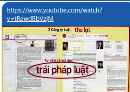
Bí ẩn của vụ án Konica Minolta/ Phần 5: Con đường đến tòa. youtube.com

Tôi đã phát Video này từ tháng 4/2019 nhưng không có ai lên tiếng nên hôm nay viết thêm bài. Tôi bận công việc, chưa tiện gọi lại cho chị để trao đổi. Tôi gửi Video này để chị xem trước nếu trước đây chị chưa xem: