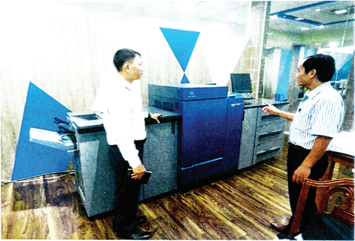
Tại mặt sau của máy in